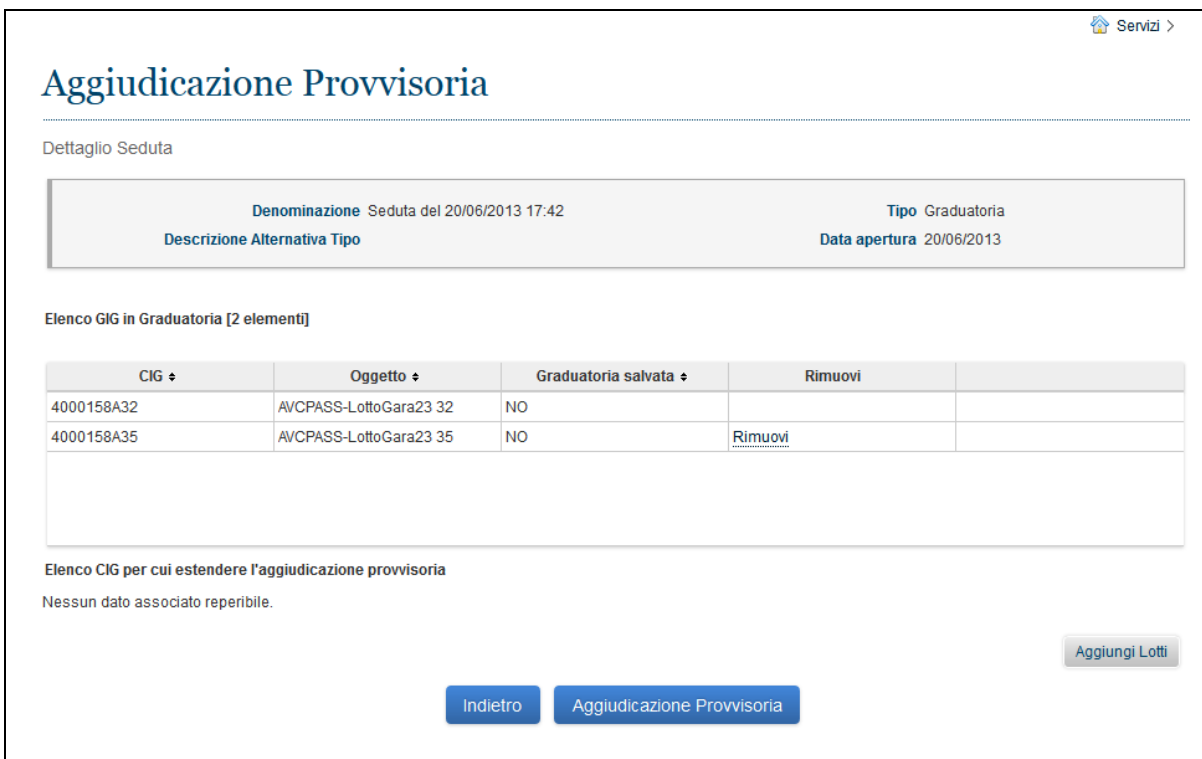
Figura 5 - Estensione Aggiudicazione Provvisoria